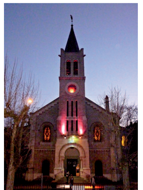
A Genève, le temple des Pâquis offre ses services (nourriture, boissons, cours, lettres, etc.) gratuitement.

FRANCIS HICKEL ET FRANÇOIS COURVOISIER, ESPACE SOLIDAIRE PÂQUIS